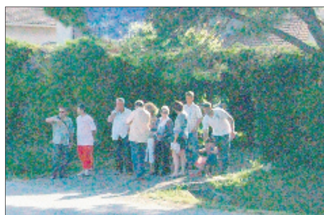
En milieu de semaine, les élus se sont rendus dans plusieurs quartiers de la commune afin de faire le point sur les travaux et réparations à envisager d'ici à la fin de l'année. Une rencontre qui a permis aux riverains de la rue des Cheynets d'échanger leurs points de vue avec les élus du conseil municipal afin d'améliorer l'environnement du quartier.