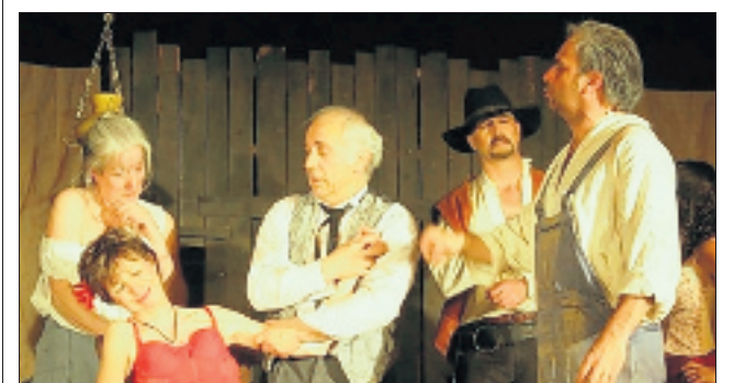
Aujourd'hui samedi 16 mai à 17 heures, les acteurs du Théâtre en toc d'Alba-la-Romaine jouent dans le cadre du printemps au théâtre antique, dans ce lieu de spectacle, le plus ancien de l'Ardèche, "Du vent dans les branches de Sassafras" de René Obaldia. Une histoire d'envie, d'argent, de jalousie, d'espoir, de cow-boys et d'Indiens. Entrée gratuite. Renseignements au 04 75 52 40 56. À 16h, visite guidée du site archéologique (3€ pour les plus de 16 ans).